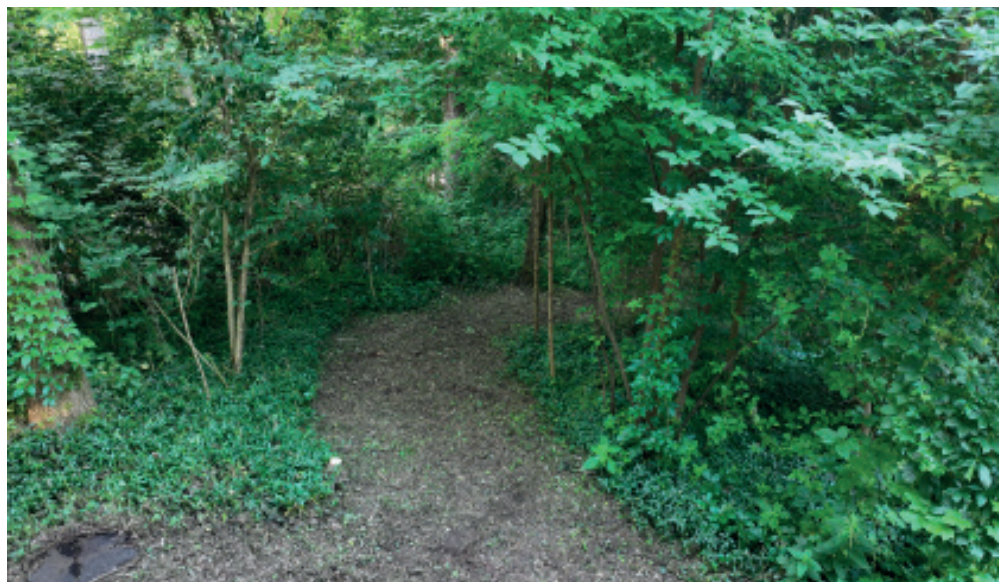
Der neue Waldstreupfad auf dem Mombacher Waldfriedhof